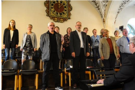
Der Projektchor beim Auftritt während der Konfirmation in der Lutherkirche 2022